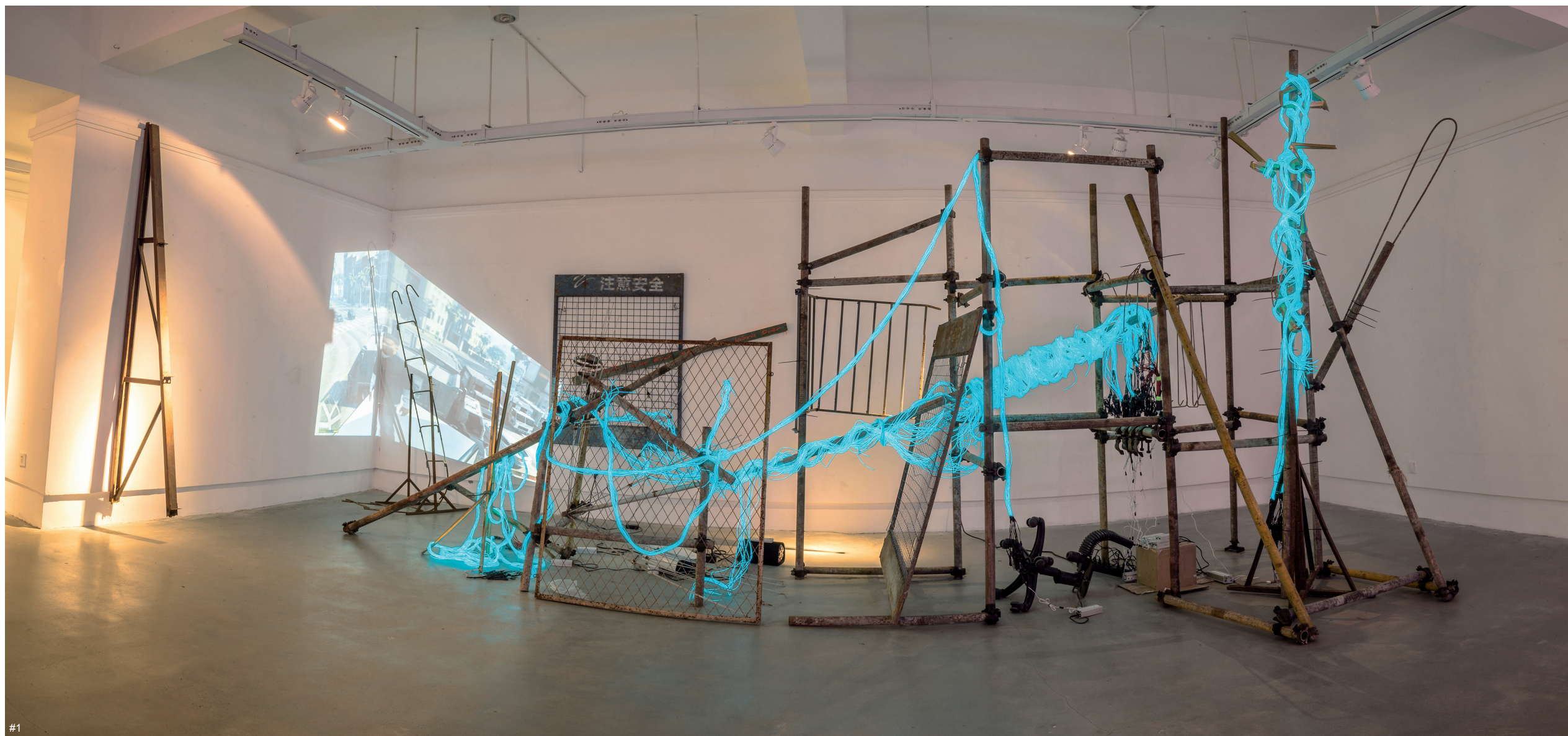
1 李子然 剩余价值生产器 冷光线、铁、铝、木、影像 尺寸可变 2017 第五届“明天当代雕塑奖”获奖作品