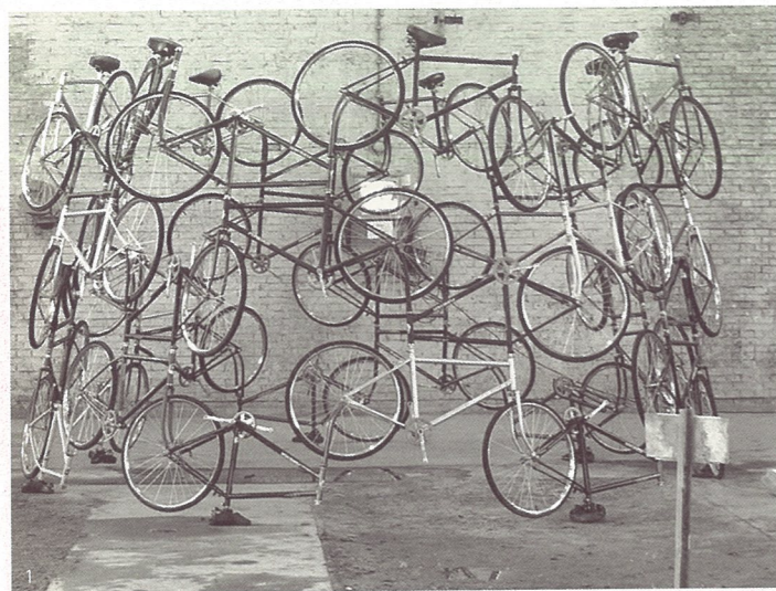
1、永久的自行车 装置 艾未未 2、外星人 装置 帕翠西娅·瓦勒 3、友好往来 装置 萧昱