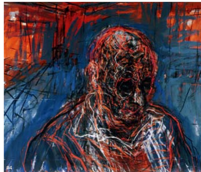
#1 无题 布面油画 奈杰尔·米尔索姆 #2 我在你的自画像中看见我自己 布面油画 克雷格·沃德尔 #3 女士（你是唯一一个为我节省的人）- 希金斯小姐肖像 布面丙烯 凯扬·塔克 #4 乌黑的大头1号（蓝底） 综合材料 大卫·费尔贝恩

奈杰尔·米尔索姆的题材是凯瑞·克劳利（Kerry Crowley），她是一个艺术商人和悉尼Yuill/Crowley画廊的负责人，这个画廊是她29年前创办的。在澳大利亚的艺术圈，凯瑞·克劳利是一个知名人士，因为她为澳大利亚当代艺术所做的贡献，2008年她获得了澳大利亚政府授予的“the Order of Australia”勋章。