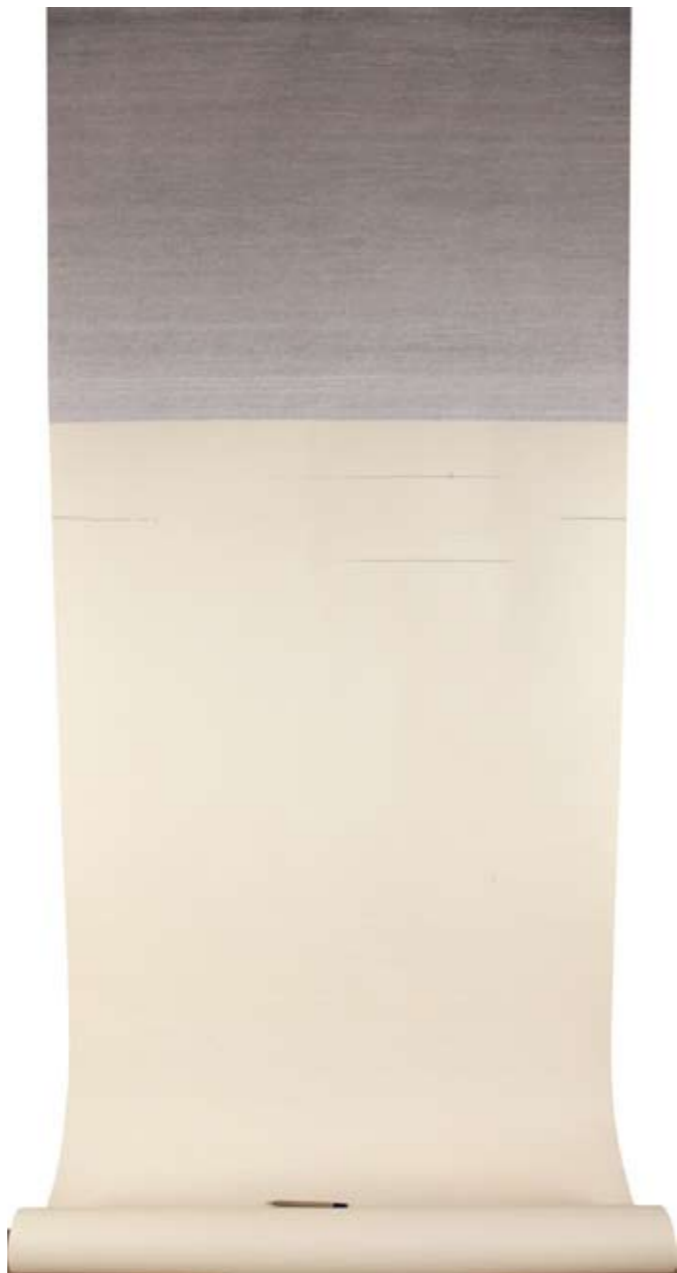
无题 装置 郑青

在《-97311》这个作品中，头发在九天（135 hours）剪下，纸张切成3mm×5mm的纸片若干张，开始在纸片上从-1写起，再用胶粘上一根头发于纸面贴到灯箱表面，继续-2，-3……直到最后一根头发数完-97311。整个过程里，是一种无“意义”的状态，（写·粘·贴）这一串简单动作的重复，（蹲下·起身·垫脚）粘贴时身体的介入，形成生命的经历轨迹，但又是一种不可言明的。在这一过程中，我的存在变得如此突出，仿佛一个人终于回到了自己。同时，我感觉到有一个模糊的东西去坚持，一个不断成形又不出现的东西，一个过程中的东西，有点盲目性，我在坚持什么？当《-97311》诞生的一刹那，我看到了我，也看到了你和他，也是那一瞬间，我才能略微接近“真实”的含义。